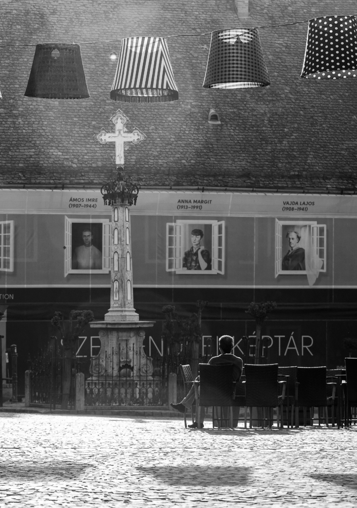
ÁMOS IMRE (1907–1944)