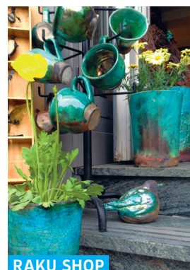
RAKU SHOP MANIFIKSTIONS

Bartók Béla utca 8. ☎ +36 26 369 397 f Dalmát Szamár bisztró