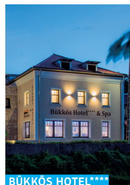
BÜKKÖS HOTEL**** & SPA

Futó utca 4. ☎ +36 70 529 2242 promenade-szentendre.hu