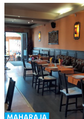
MAHARAJA INDIAI ÉTTEREM

Bogdányi utca 8. ☎ +36 70 381 5043 www.rakumuveszet.hu