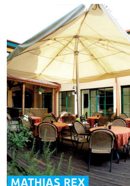
MATHIAS REX PANZIÓ ÉS ÉTTEREM

Görög utca 4. ☎ +36 26 319 345 f MargaretaCukraszda