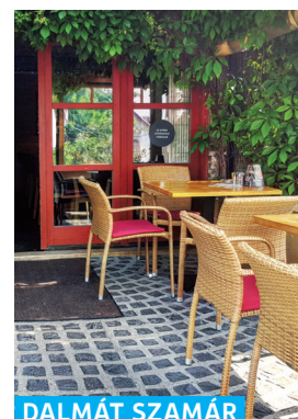
DALMÁT SZAMÁR BISZTRÓ

Kossuth Lajos utca 16.. ☎ +36 26 505 570 www.mathiasrexhotel.hu