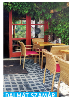
DALMÁT SZAMÁR BISZTRÓ

Kossuth Lajos utca 16.. ☎ +36 26 505 570 www.mathiasrexhotel.hu