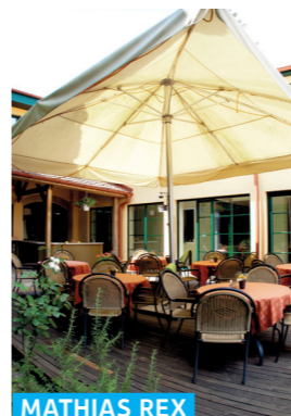
MATHIAS REX PANZIÓ ÉS ÉTTEREM

Görög utca 4. ☎ +36 26 319 345 f MargaretaCukraszda