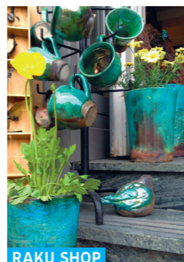
RAKU SHOP MANIFIKASTIONS

Bartók Béla utca 8. ☎ +36 26 369 397 f Dalmát Szamár bisztró